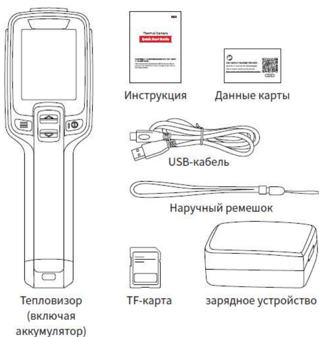
Рис. 1. Стандартный комплект поставки